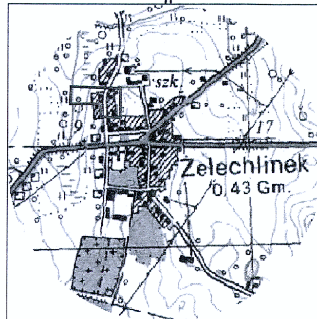
SZKIC ORIENTACYJNY skala 1:10 000

Nie wyklucza się istnienia w terenie innych nie wykazanych na niniejszej mapie urządzeń podziemnych, które nie były zgłoszone do inwentaryzacji lub o których brak jest informacji w instytucjach branżowych Punkty osnowy geodezyjnej podlegają ochronie (ustawa z dnia 17.05.1989r. - Prawo Geodezyjne i Kartograficzne . Rozporządzenie Ministra Spraw Wewnętrznych i Administracji z dnia 15.04.1999 r. - Dziennik Ustaw Nr 45 poz. 454 ).